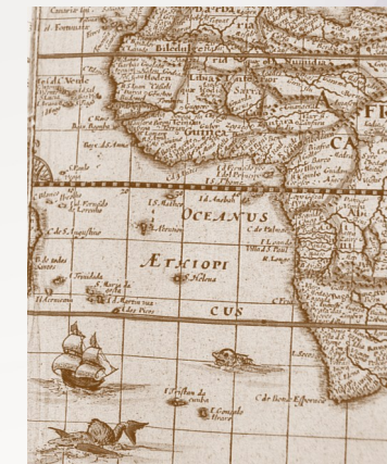
In "Ioan Blaeu Grande Atlas do Mundo", publicado em colaboração com a Real Sociedade Geográfica de Londres, Verbo.